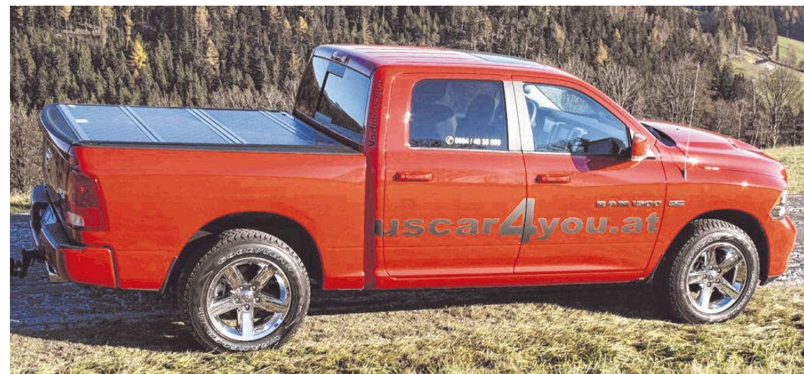
Ein Amerikaner auf unseren Straßen: Der Dodge Ram fällt auf, egal, ob auf dem Land oder in der Stadt.

Ausstattung: So wie er da steht, ist er schon eine Wucht. Und da ist ganz schön viel da-