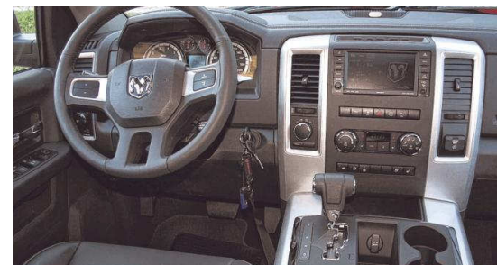
Allein das Cockpit mit der auffällig breiten Mittelkonsole und dem Schalthebel vermittelt Stärke.

In Graz und GU erhältlich: www.uscar4you.at