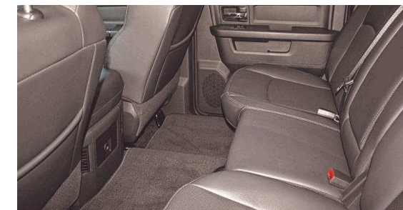
So etwas nennt man Beinfreiheit: Auf der Rückbank des Dodge Ram findet jeder Platz.