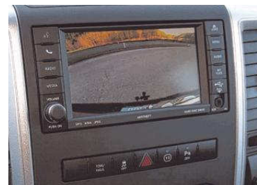
Die Rückfahrkamera ist bei diesem 6-Meter-Monster eine große Hilfe.